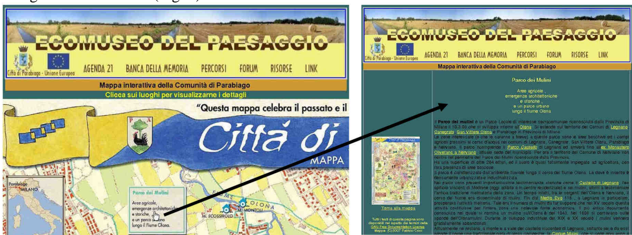
Fig. 1 La mappa interattiva della comunità

Ogni oggetto rappresentato sulla mappa è collegato tramite un hyperlink a una pagina web di approfondimento contenente testi, immagini, fotografie, interviste e quant’altro necessario a dettagliarne i contenuti. (Fig. 1)