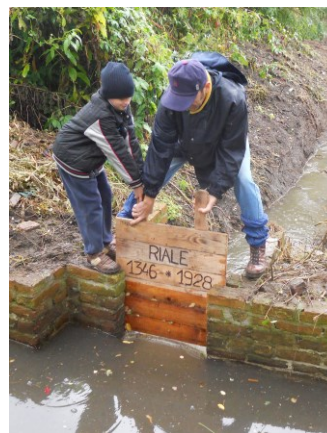
Alla ricerca del Riale perduto