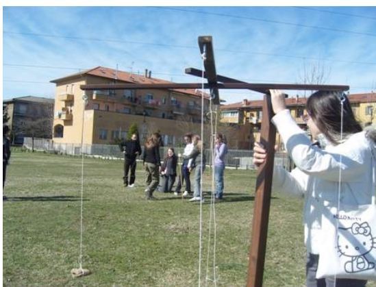
Itinerario virgiliano. Alla scoperta di Parabiago romana

Il sito dell'Ecomuseo è composto da oltre 1500 pagine web, 3400 immagini, 250 documenti di testo, 200 audioregistrazioni, 20 videoregistrazioni sul patrimonio culturale e naturale di parabiago. Contiene anche la mappa interattiva della comunità e i risultati delle attività didattiche svolte dall'Ecomuseo e direttamente dalle scuole.