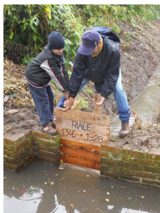
Alla ricerca del Riale perduto