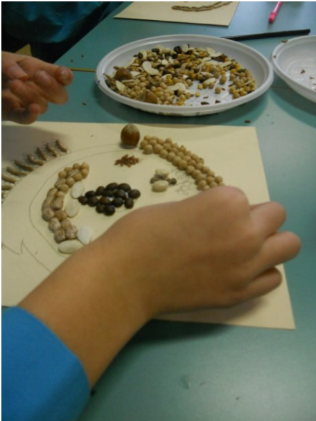
Intavolarsi. Dalla vigna alla tavola - Il cibo dei 5 sensi. Anno scolastico 2014/2015