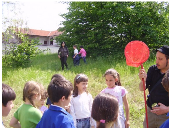
Scopriamo l'aula verde

Per pubblicare i risultati delle attività didattiche, L'ecomuseo mette a disposizione delle scuole lo spazio del proprio sito web e le competenze necessarie.