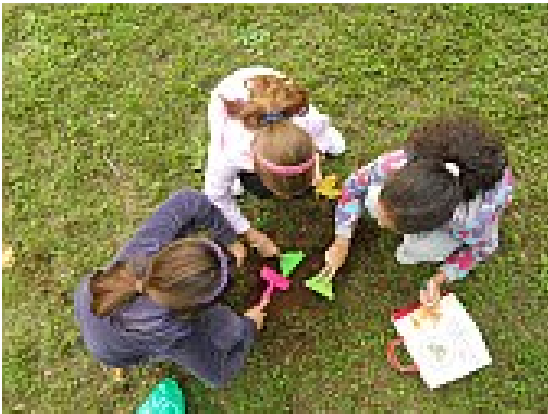
Intavolarsi: dalla "vigna" alla tavola