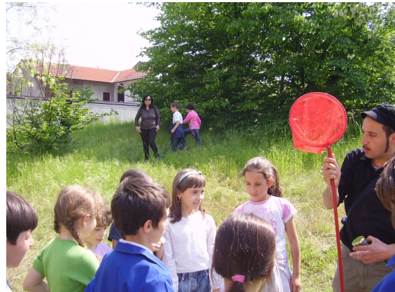
Scopriamo l'aula verde

Per pubblicare i risultati delle attività didattiche, L'ecomuseo mette a disposizione delle scuole lo spazio del proprio sito web e le competenze necessarie.