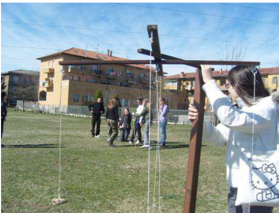
Itinerario virgiliano. Alla scoperta di Parabiago romana

Il sito dell'Ecomuseo è composto da oltre 1500 pagine web, 3400 immagini, 250 documenti di testo, 200 audioregistrazioni, 20 videoregistrazioni sul patrimonio culturale e naturale di parabiago. Contiene anche la mappa interattiva della comunità e i risultati delle attività didattiche svolte dall'Ecomuseo e direttamente dalle scuole.