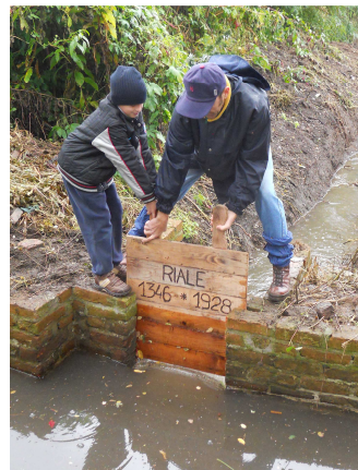
Alla ricerca del Riale perduto