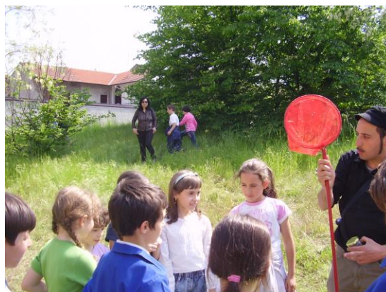
Scopriamo l'aula verde

Per pubblicare i risultati delle attività didattiche, L'ecomuseo mette a disposizione delle scuole lo spazio del proprio sito web e le competenze necessarie.