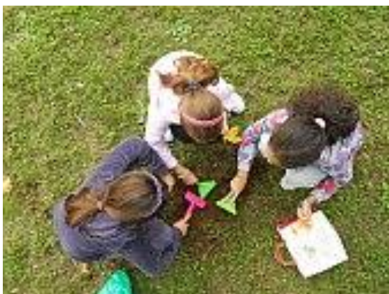
Intavolarsi: dalla "vigna" alla tavola