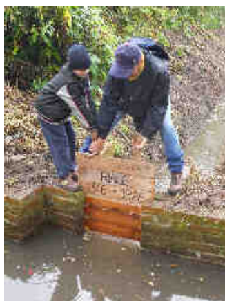
ALLA RICERCA DEL RIALE PERDUTO