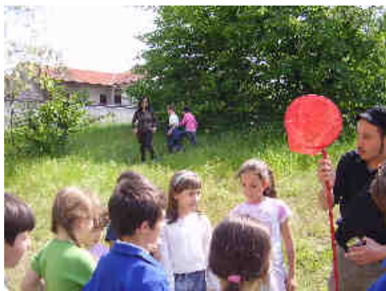
SCOPRIAMO L'AULA VERDE

PER PUBBLICARE I RISULTATI DELLE ATTIVITÀ DIDATTICHE, L'ECOMUSEO METTE A DISPOSIZIONE DELLE SCUOLE LO SPAZIO DEL PROPRIO SITO WEB E LE COMPETENZE NECESSARIE.