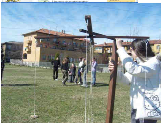
ITINERARIO VIRGILIANO. ALLA SCOPERTA DI PARABIAGO ROMANA

Contiene anche la mappa interattiva della comunità e i risultati delle attività didattiche svolte dall'Ecomuseo e direttamente dalle scuole.