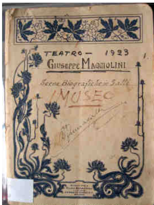
Gli e-book dell'Ecomuseo del paesaggio di Parabiago - 2015

Sul sito web dell'Ecomuseo alla pagina "Officina Maggiolini" sono disponibili svariati materiali didattici, e-book, documenti storici tra cui un'opera teatrale, video, immagini e link utili relativi all'insigne intarsiatore parabiaghese. Alcuni documenti sono in corso di stesura. Come di consueto è gradita qualsiasi collaborazione per migliorare i contenuti e la forma del materiale.