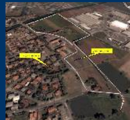
Itinerari per la fruizione