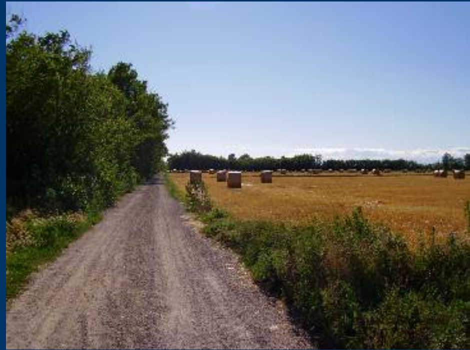
Strada del Signù – I Sec. d.C.?

... dove le conoscenze si estendono e diramano attraverso il passato vissuto dalla comunità per giungere nel presente, con un'apertura sul futuro