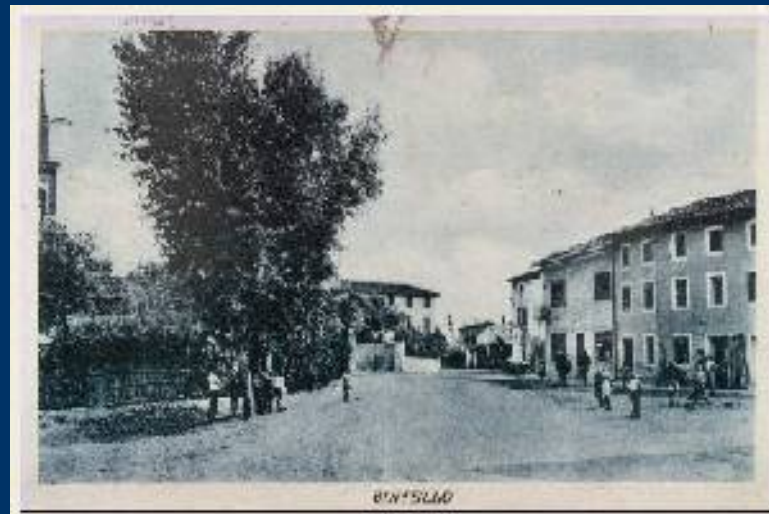
Cartoline e fotografie