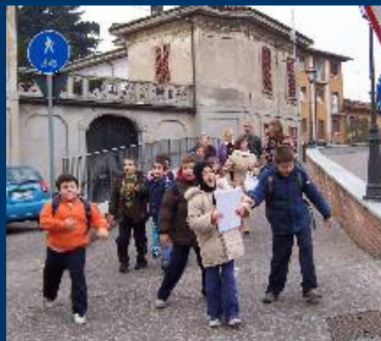
Attività con le scuole